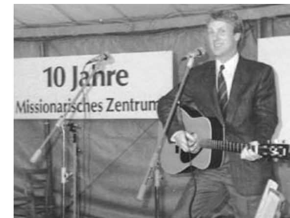
10 Jahre MZ Hanstedt 1989