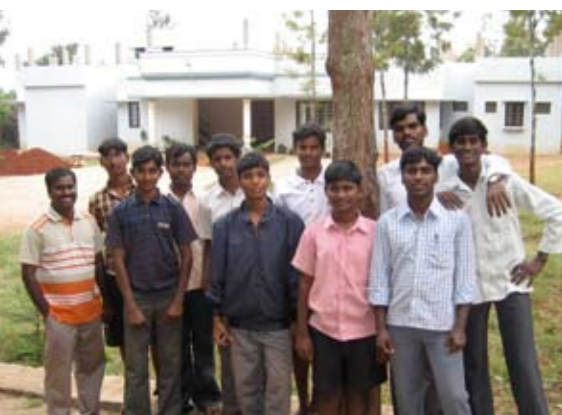
Life-Trainees (Hausgemeinde) vor neuem Mehrzweckgebäude