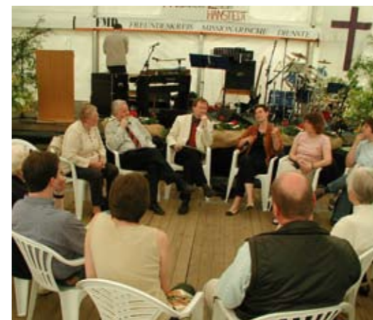
25 Jahre MZ Hanstedt 2004