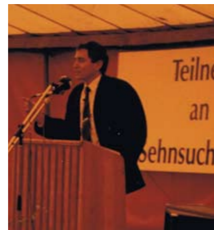
10 Jahre MZ Hanstedt 1989