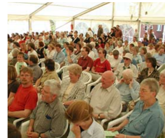
2004 (Dieses Festzelt wird auch am 1. Mai 2009 wieder aufgebaut)