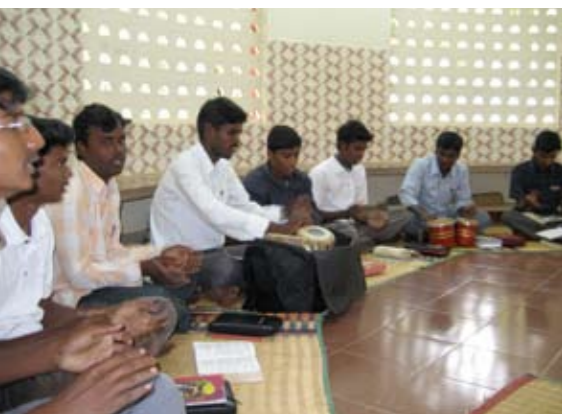
Andacht Life-Trainees Yelligiri-Zentrum Shalom

Möge unser Herr das Missionarische Zentrum segnen und jene, die dort mitbestimmen in seinem Sinn leiten. Preist den Herrn für diesen 30. Geburtstag! Shalom!