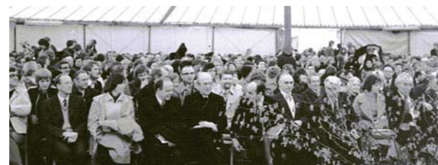
Eröffnung des MZ Hanstedt 1979

Ich bin dankbar, dass meine Kirche sich den Dienst des Missionarischen Zentrums nicht nur gefallen lässt, sondern dass sie diesen Dienst ausdrücklich will und ihn tatkräftig unterstützt. Ich bin dankbar für die vielen Menschen, die sich zum Freundeskreis Missionarische Dienste halten und durch ihr vielfältiges Opfer ermöglichen. Ich bin gewiss, dass Gott auch weiterhin diese Arbeit, seine Kirche, die Mitarbeiter und die Freunde und Freundinnen segnen wird.