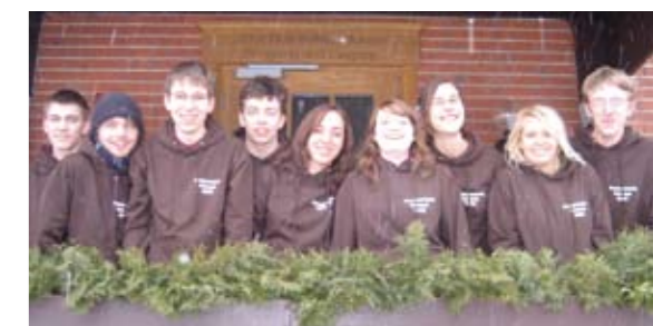
Hausgemeinde mit neuen Pullovern